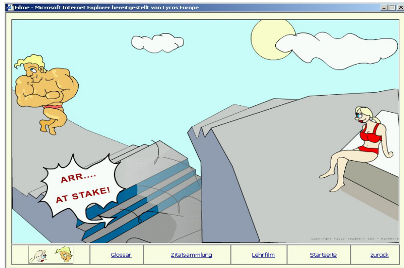
Screenshot 3: "Cartoon"

Nach diesem kurzen festgelegten Einstieg über das dramatische Schema ist nun eine freie spielerische Navigation möglich. Sie soll die Studenten dazu motivieren, sich auf ihre erste Pitching-Sitzung und das, was als zentrale Aspekte auf sie zukommen wird, vorzubereiten. Sie treffen dabei auf unterschiedliche Lern- und Informationstypen: