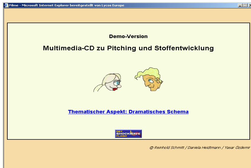
Screenshot 1: "Startseite"

Das Lernprogramm teilt sich in zwei Bereiche: Der Einstieg ist festgelegt. Die Nutzer treffen zuerst auf das Dramatische Schema in Form einer Grafik und können von dort aus zu einem Cartoon gelangen, der als kleiner Zeichentrickfilm die vier relevanten Kategorien des Dramatischen Schemas ausfüllt: Protagonist, sein Ziel, ein zu überwindendes Hindernis und die Kosten für ihn, sollte er an dem Hindernis scheitern.